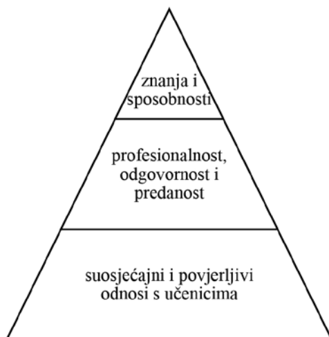
Grafikon 2. Hijerarhija cijjenjenih kvaliteta dobrog učitelja (McKnight i sur., 2011, str. 44)